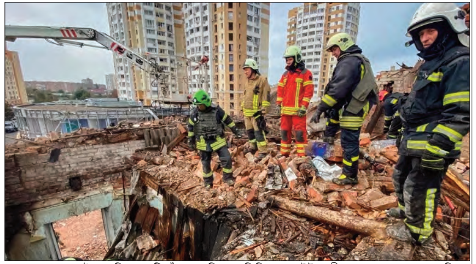
প্রত্যেকবারের প্রচেষ্টায় রাশিয়া ২০টি সাঁজোয়া দিয়ে হামলা করছে।